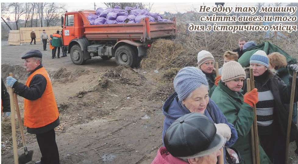
Не одну таку машину сміття вивезли того дня з історичного місця

10 грудня на Замковій горі вже з дев'ятої ранку збиралися люди, підтягуючи техніку, звозячи необхідні матеріали, інструменти, устаткування.